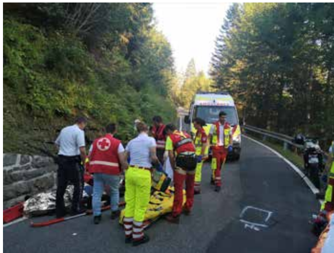
Beispiel eines Erste Hilfe Einsatz der First-Responder Gruppe auf der Landesstraße L51

aus gesetzlichen Gründen keine Auskünfte geben. Dafür bewährt sich aber seit April 2017 die Gesundheitsberatung 1450, die auch in der Rettungs- und Feuerwehrleitstelle in Feldkirch angesiedelt ist. Die telefonische Gesundheitsberatung dient als persönlicher Wegweiser durch das Gesundheitssystem und führt dorthin, wo man im Moment die beste Betreuung erhält.