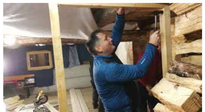
Arbeiten bei der Hüttenrenovierung

Auf die Saison 2019/20 freuten wir uns ganz besonders, da wir mit Hilfe von vielen tatkräftigen und fleißigen Helfern unsere Schihütte renovieren konnten: Der Ofen in der Stube wurde repariert, der Stubenboden wurde isoliert und die Küche erhielt einen neuen Holzherd. Der Gang zu den Toiletten und in den Stall wurde wunderschön getäfelt und sorgt somit für ein ganz besonderes Ambiente, wenn man länger warten muss oder wenn das Telefon mal plötzlich läuten sollte... Ebenso wurde in unzähligen Stunden und Tagen der frühere Stall zu einem sehr gemütlichen Hüttenstyle-Party-Raum umfunktioniert, damit der immer größer werdende Kadernachwuchs genug Platz hat, um sich nach den aktiven Trainingsstunden zu stärken. Zugleich wurden auch noch Aufhängevorrichtungen für die Kader-Schibekleidung im oberen Stock angebracht. Es ist wirklich wunderschön geworden und