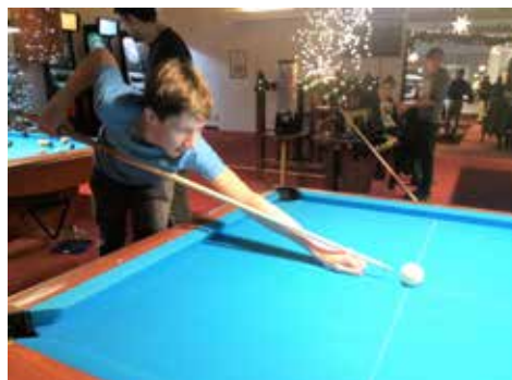
Jahresabschluss beim Billiardspiel

Da unsere Jugendlichen für das Kinder-Theater doch schon ein bisschen herausgewachsen sind, wurden sie zum Jahresabschluss zwar auch zum Pizzaessen eingeladen, doch statt Theater wurde diesmal Billiard gespielt.