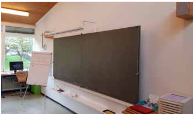
Eine alte Kreidetafel (über 50 Jahre im Dienst)