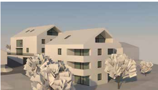
Gesamtansicht von Richtung Südwesten