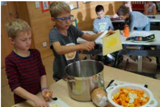
Ran an den Kochlöffel...

Welche Gemüsesorten im Herbst bei uns geerntet werden können, stand bei den Kleinen im Sachunterricht auf dem Programm. Das wollte mit allen Sinnen erlebt werden. Deshalb versuchten sie sich als Kürbissuppenköche. Es gab dann eine leckere Suppe in der großen Pause für alle Kinder.