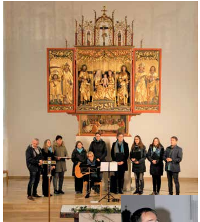
Messgestaltung in Brederis