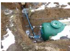
Alpe Wies Wasser- versorgung