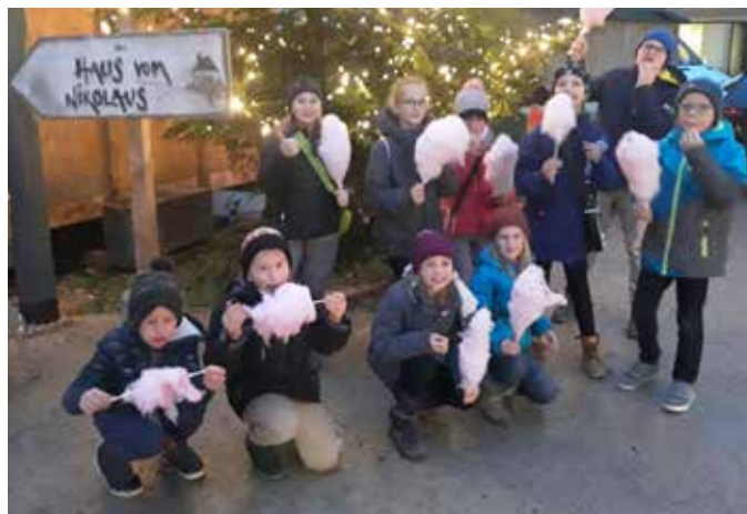
Leckere Zuckerwatte beim Christkindlmarkt

Am 4. Adventssonntag war für die Kindervolkstanzgruppe wieder der Besuch im Vorarlberger Landetheater in Bregenz angesagt. Vevi, die heutige Hauptdarstellerin, die bei ihrer Tante aufwächst, findet alles schrecklich: Immer diese Regeln, Schulaufgaben und brav sein. Als ihr dann eine Maus eine geheimnisvolle Wurzel schenkt, beginnt für unsere Tanzkinder ein großes Abenteuer und endet in einem berührenden Theatererlebnis. Anschließend wurde noch durch den Christkindlmarkt geschlendert und Zuckerwatte verspeist. Im Restaurant „San Michele“ in Rankweil ließen wir dann den Abend mit Pizzaessen ausklingen.