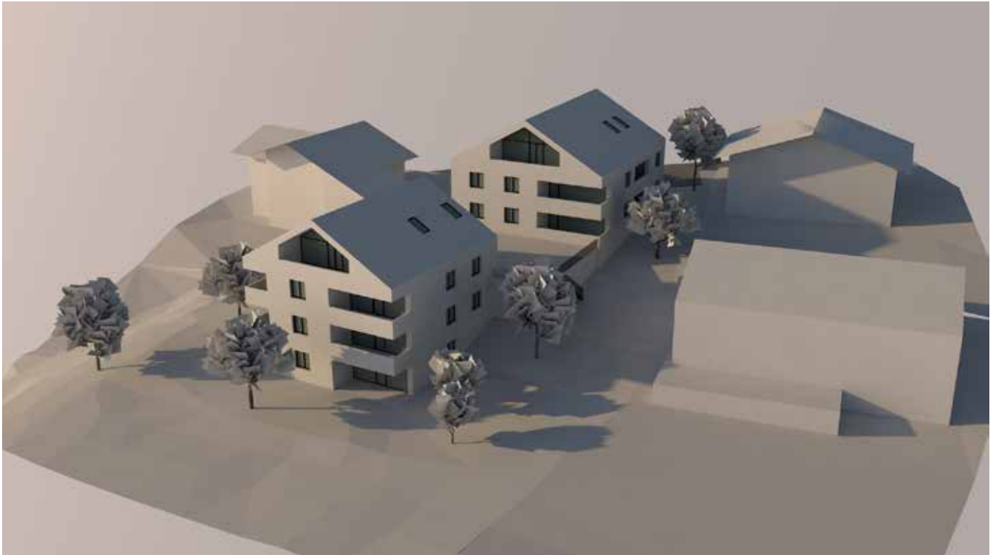
Gesamtansicht der Wohneinheiten von Richtung Südosten