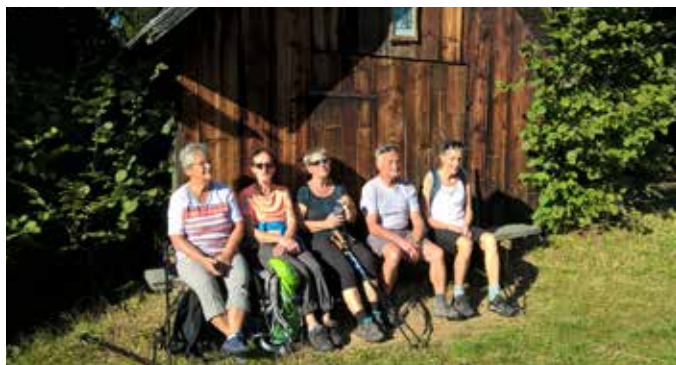
Übersaxen - Satteinser Gulm