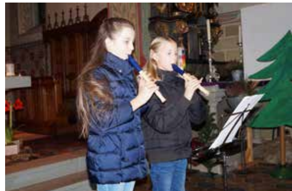
Alle Jahre wieder...

In der Adventszeit stand allerlei Besinnliches auf dem Programm. Wir trafen uns jeden Montag im Kreis rund um den Adventkranz. Wir hörten Geschichten und sangen Lieder. Auch unser „Freitags um 10“ wurde in die Bibliothek verlegt, um gemeinsam zu singen und Geschichten zu hören. Etwas Besonderes war dann der Besuch unserer Erstklässler beim Seniorennachmittag. Die Kinder sangen Lieder und trugen Gedichte vor.