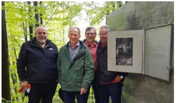
Projektbeispiel: „Marsellatreff“, Dafins

machen. Sie stärken beispielsweise kulturelles Erbe, verdichtetes und nachhaltiges Bauen, entwickeln Vermarktungsstrategien für regionale Produkte und vieles mehr. Allein in der Vorderland-Region wurden seit Juni 2015 18 LEADER-Projekte umgesetzt, was rund € 630.000 an EU-Geldern in diese Region brachte. Zusätzlich 6 in Kooperation mit der Region Walgau und der Stadt Bludenz.