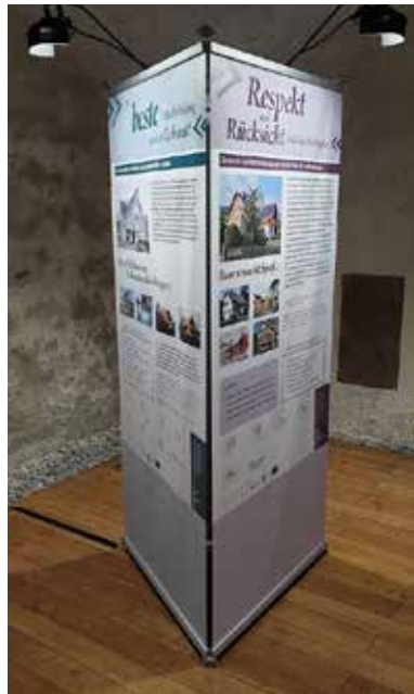
LEADER-Projekt: Mach mehr aus deinem Wohnhaus, Göfis

Rund € 320.000 Fördermittel stehen nun noch für neue Projekte zur Verfügung. In dieser Förderperiode, die offiziell im Dezember 2020 endet, wird es möglich sein, Projekte noch bis voraussichtlich