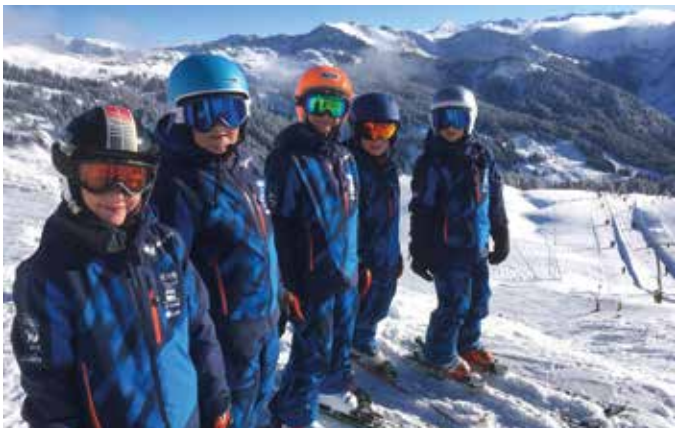
Hochjoch, erste Ausfahrt mit unseren neuen Schianzügen

Am 30. November durften wir beim 2. Schitaining am Hochjoch unsere neue Kollektion präsentieren, die auch von einigen anderen Vereinen bestaunt und gelobt wurde. „Des neue Schihäs schaut einfach voll cool us, vorallem wenn so viele mitanand da Hang abe blosand.“