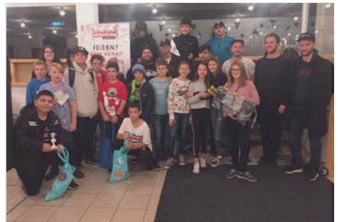
Gruppenfoto der Turnierteilnehmer