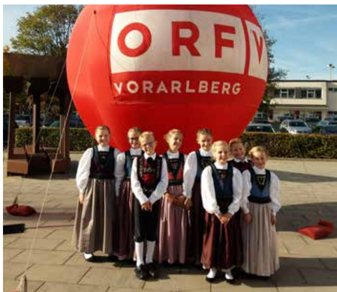
Bereit für den Live-ORF Auftritt unserer Kindertanzgruppe im Landesstudio Dornbirn

Dieser Auftritt im ORF war für unsere Kindertanzgruppe ein wunderschönes Erlebnis und sollte für 2019 nicht der letzte Auftritt im Fernsehen sein, denn vier Tage später war „Guten Morgen Österreich“ live in Laterns und 5 Kindertrachtenpaare konnten in ihrer originalen Laternser Tracht einige Tänze vor laufender Kamera zum Besten geben.