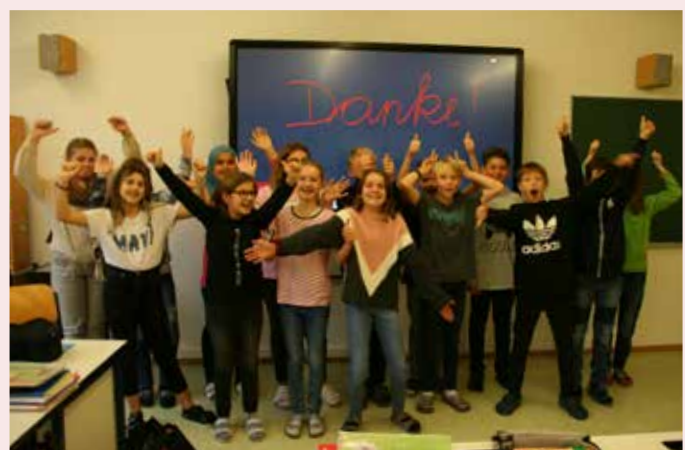
DANK E !!!