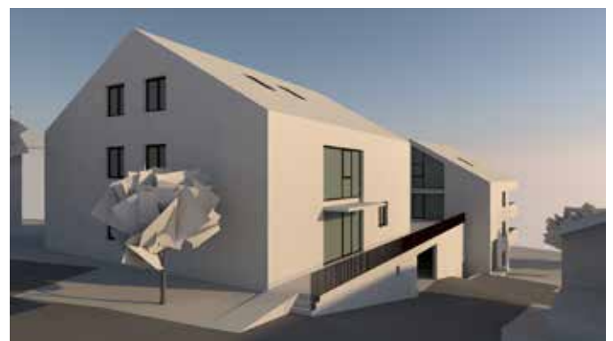
Sicht von der Unterkirchdorfstraße

Durch diese Gliederung der Baukörper wird eine Maßstäblichkeit erreicht, die der bestehenden Bebauungsstruktur entspricht. Die beiden Wohnhäuser sind maximal drei Vollgeschosse hoch und besitzen ausgebaute Dachgeschosse.