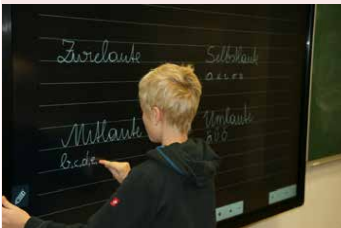
Arbeiten an der neuen digitalen Tafel