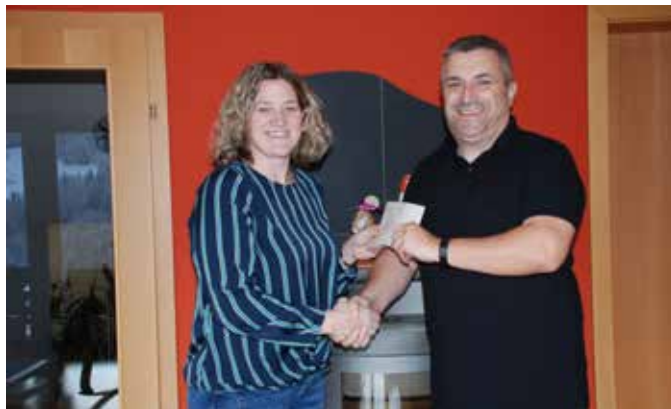
Spendenübergabe an die Firstresponder Gruppe