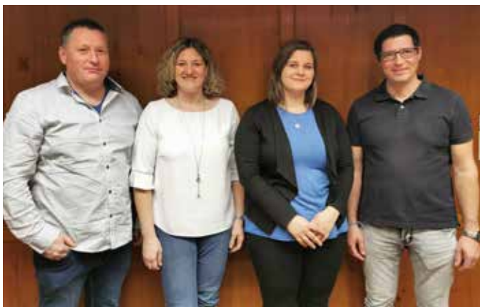
Die Ausschussmitglieder "Familie und Kultur"