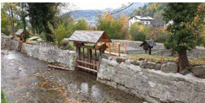
Projektbeispiel: „Kultur_gut_Trift“ in Rankweil. Flözerei Erlebnisweg