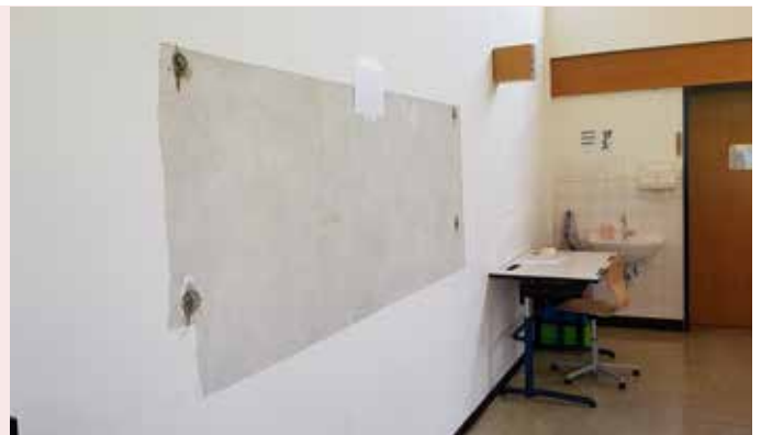
Wand ohne Tafel