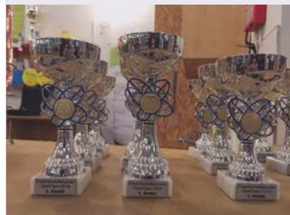
Es warteten tolle Pokale