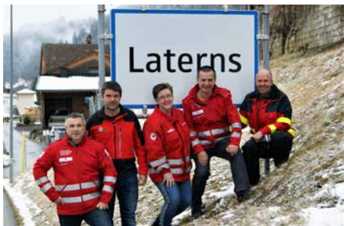
First Responder Gruppe Laterns

Wir, die First Responder, sind als Rettungs-Sanitäter gerne in Notfällen zur Stelle. Oft werden wir aber auch privat kontaktiert und nach medizinischen Ratschlägen gefragt. Leider können und dürfen wir