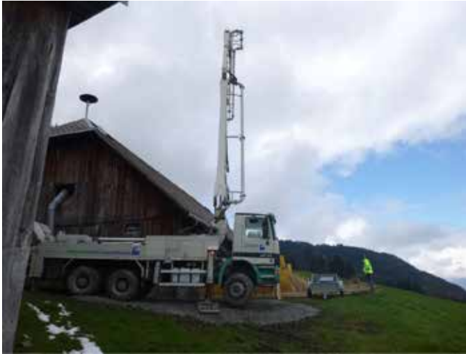
Bau Mistlager Alpe Wies